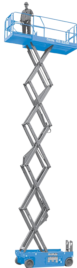
03/17, Ersatzteil Nr. B109379DE